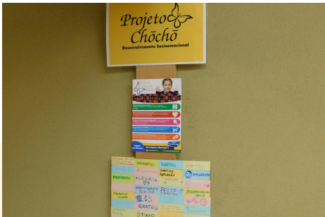
International Institute of Education and Culture (静岡県)