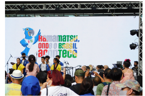
ブラジリアンデー (静岡県)